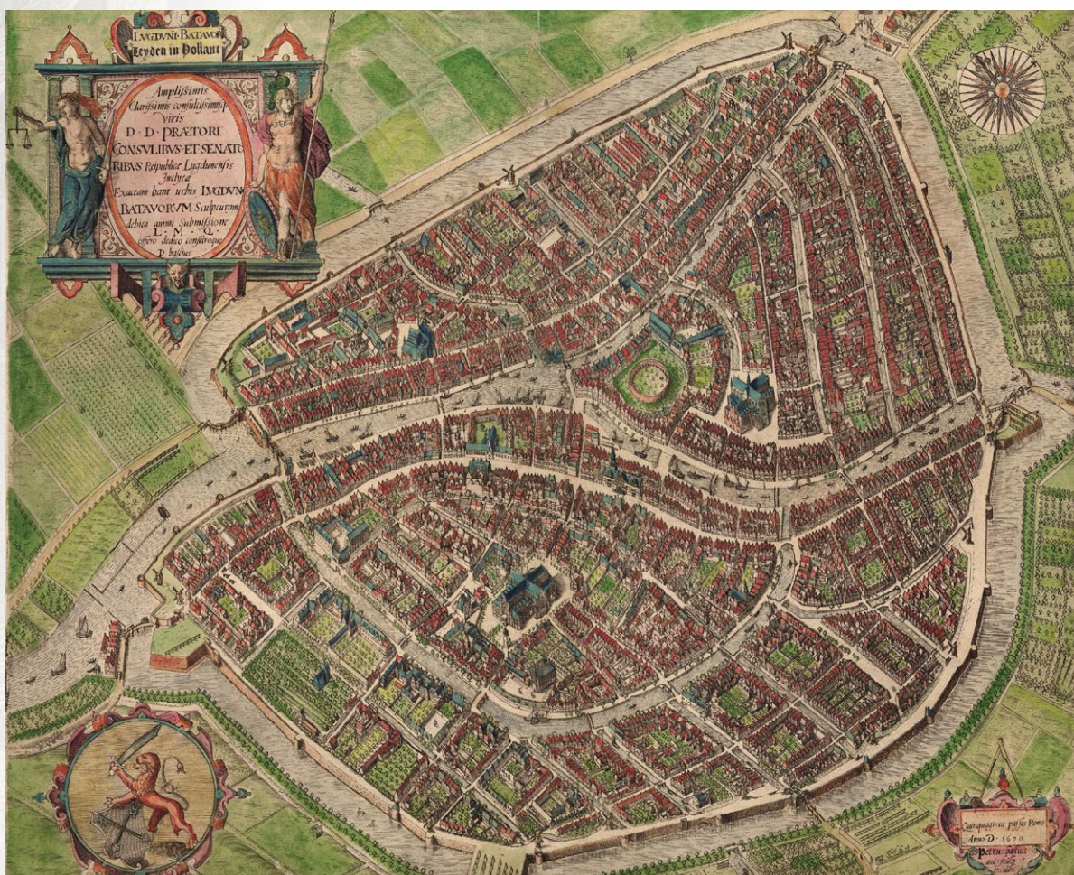
Stadsplattegrond Leiden in 1600 door Bast.

De Thanksgiving Day Service in de Pieterskerk Leiden is een niet-confessionele dienst op de ochtend van Thanksgiving Day in de historische Pieterskerk in Leiden. Voor Amerikanen is Thanksgiving in de Pieterskerk in Leiden uniek. In deze kerk registreerden de Pilgrims hun geboorten, huwelijken en sterfgevallen. Zij woonden en kerkten in de nabije omgeving van de kerk tussen 1609 en 1620. De Pilgrims speelden een belangrijke rol in het begin van de kolonisatie van Noord-Amerika.