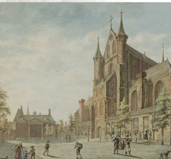
P. Schouten, 1782. Erfgoed Leiden en Omstreken.

PS|theater, stadsgezelschap van Leiden, onderzoekt in 2020 de dorpse stad. Hoe verhoud je je als kleine gemeenschap tot de grote wereld? Hoe houd je vast aan je eigen identiteit? En hoe krijgt de milde middenmoot, in het kabaal van schreeuwende boze burgers, alsnog een stem? In een tijd waarin globale issues op lokaal niveau worden uitgevochten, richt PS|theater zijn speren op kleine gemeenschappen. Want het verhaal van deze tijd wordt niet in Brussel, Washington of Beijing gemaakt, maar op lokaal niveau in de kantines. In het najaar van 2020 presenteert PS|theater een voorstellingsreeks langs gemeentehuizen, verenigingsgebouwen en voetbalkantines in de Leidse regio. Hierin wordt de lokale democratie gevierd als een dorpsfeest en wordt er gehakt gemaakt van de globaliserende wereld.